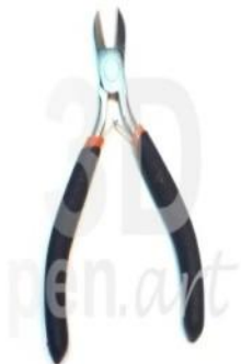
Бокорезы для 3D ручки

Для того, чтобы отрезать вышеуказанные хвостики или обрезать лишнее на поделке, чаще всего используют бокорезы.