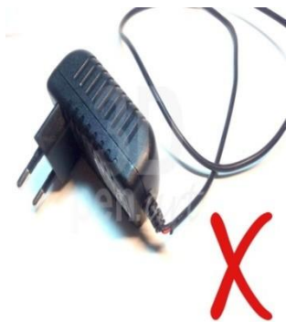
Поврежденный блок питания для 3D ручки

При работе с любым нагревательным или электрическим просто необходимо соблюдать технику безопасности. От соблюдения всех норм зависит как сохранность оборудования, так и твое личное здоровье. 3D ручка не является исключением, так как это электрический прибор с нагревающимся элементом. В этой статье мы разберем все меры предосторожности при работе с 3D ручкой