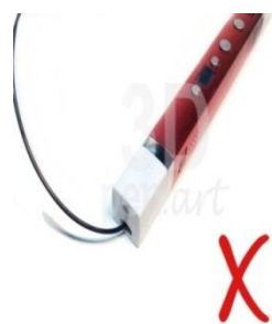
Пластик в 3D ручке

остывает. Однако, даже с такой функцией, по завершении работы обязательно отключайте прибор от сети, предварительно вытащив весь пластик из 3D ручки.